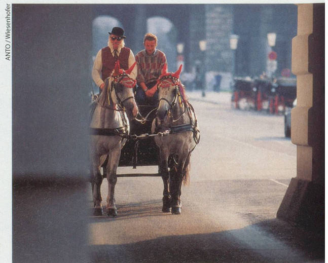
Une promenade en fiacre et nous voilà revenus à l'époque de l'impératrice Sissi