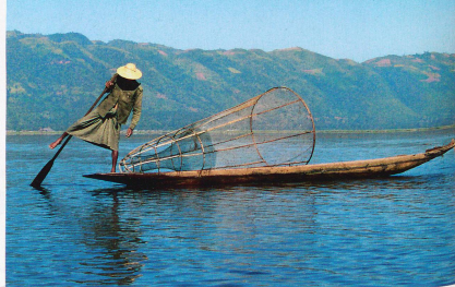
Les pêcheurs du lac Inle dansent avec leur pagaie pour faire avancer leurs pirogues.

Bien sûr, il n'est pas possible d'aller partout et de parler de tout. Même si elles s'ouvrent peu à peu, de nombreuses régions du Myanmar sont interdites aux étrangers. Dans les années 90, les montagnes de Kyaiktiyo et le célèbre Rocher d'Or étaient inaccessibles aux voyageurs. Et pourtant, avec la complicité et les rires des Birmans, il était possible de dormir au pied du rocher en équilibre précaire et