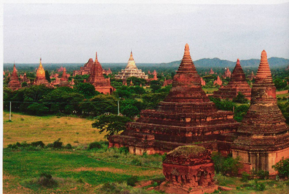
Bagan est le site archéologique le plus impressionnant d'Asie du Sud-Est. Sur la plaine abandonnée, des centaines de pagodes et de stupas s'élevaient vers le ciel. Derniers vestiges d'une civilisation disparue.