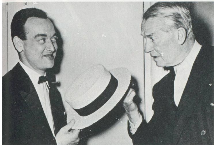
Chapeau bas, la rencontre avec un très grand monsieur de la scène en 1957, au Casino Théâtre de Genève: Maurice Chevalier en personne.

genevois souffle ses 90 bougies en brûlant de spectacle.