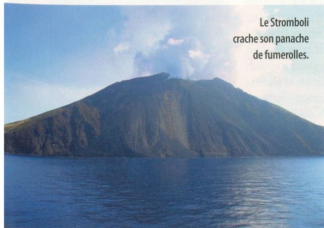
Le Stromboli crache son panache de fumerolles.