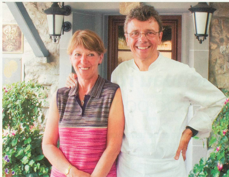
P.-M. - Delessert

«La démarche pour ce deuxième imprimé a été radicalement différente, précise Gérard Rabaey. J'ai voulu sortir du contexte du Pont de Brent et aller vers le grand public. Je me suis fixé un objectif: proposer des recettes qui puissent