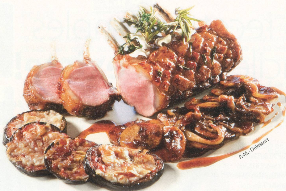
P.-M. - Delessert