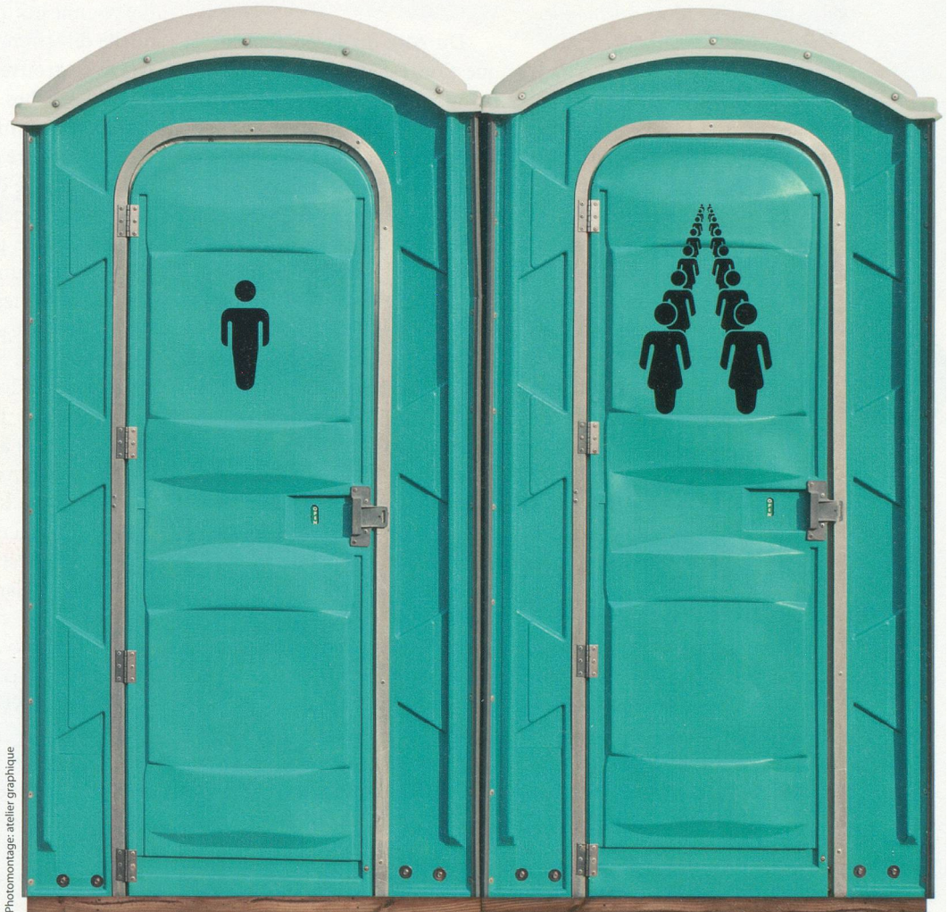
Photomontage: atelier graphique

Quiconque a déjà fréquenté le Montreux Jazz Festival le sait: durant les entractes, ou entre deux concerts, il est plus facile d'aller au Palace soulager ses besoins plutôt que tenter de le faire au Centre des congrès. Le problème ne semble cependant pas spécialement préoccuper l'organisation.