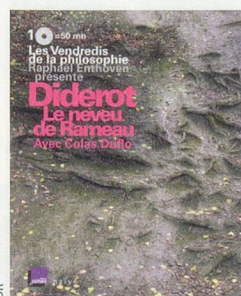
«Le neveu de Rameau» de Diderot, 1 CD, Raphaël Enthoven, Naïve, 44 fr. 80

Note: OGM, pour ou contre? Le débat, collection Jouvence, 160 pages, prix conseillé 28 fr.