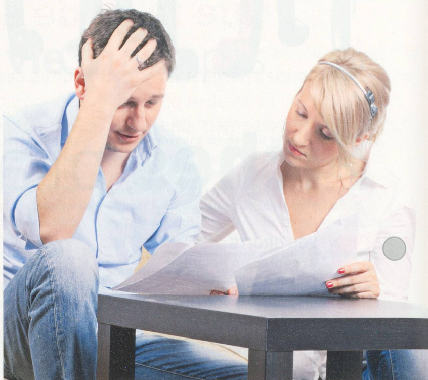
Un héritage cache parfois de mauvaises surprises. Sans le savoir, on a accepté des dettes ou des actes de défaut de biens non prescrits.