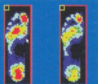
sans E26® avec E26®

L'Epithelium 26® est un gel de silicone breveté, véritable substitut au capiton plantaire sain. Il est le matériau idéal pour soulager pressions et frottements.