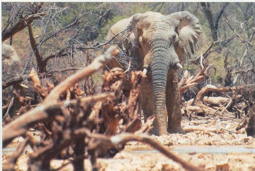
Très peu de gens sont au courant et encore moins les ont vus, mais près de 350 éléphants sillonnent les forêts d'épineux entre le Burkina Faso et le Mali.

Comme celle du pays Dogon, cette peuplade se compose essentiellement d'agriculteurs et vit hors du temps sur les falaises de Bandiagara. Michel Drachous-