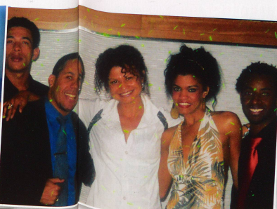
Alegria Tropical, le groupe dominicain trois étoiles qui jouait à bord.