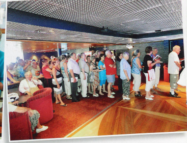
Une file de 400 fans, tous livre en main, et trois heures de signatures.