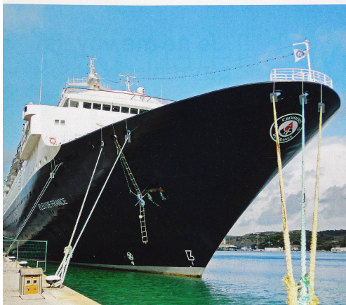
Le Bleu de France, joyau à taille «humaine», qui propose mille activités: piscines, jacuzzi, fitness, spa, etc.