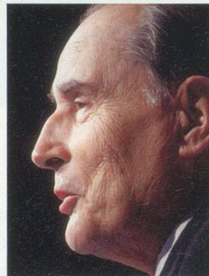
Président de la République française, le très sérieux François Mitterrand (1916-1996) s'entretenait régulièrement avec l'astrologue Elisabeth Teissier.