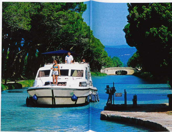
Le passage des écluses est un moment toujours délicat, parfois épique, mais aussi riche en souvenirs inoubliables pour les plaisanciers.

ville rose de Toulouse: quelque 240 kilomètres creusés à la pelle et à la pioche par des milliers de journaliers, ces ouvriers de campagne qui louaient alors leurs bras aux plus offrants; une septantaine d'écluses, toutes de forme ovale pour éviter les remous – une idée qui est loin d'avoir fait l'unanimité par la suite – une ville entièrement nouvelle (Sète, fondée à la fin du XVII e siècle au débouché méditerranéen du nouveau canal appelé alors, un peu pompeusement, «canal royal du Languedoc»), sans oublier une multitude de petits ports fluviaux ouverts à l'époque sur un avenir économique prometteur: Béziers, Capetang, Trèbes, Carcassonne, Castelnaudary, Bram, Toulouse bien sûr. En