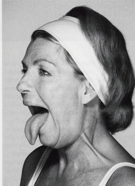
DOUBLE MENTON Cet exercice prévient le double menton et renforce le bas du visage. De face, la tête droite, les épaules abaissées et souples, tirez la langue le plus loin possible vers l'avant, la bouche grande ouverte. Ce faisant, la mâchoire se rapproche du cou.