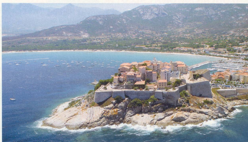
La citadelle de Calvi.