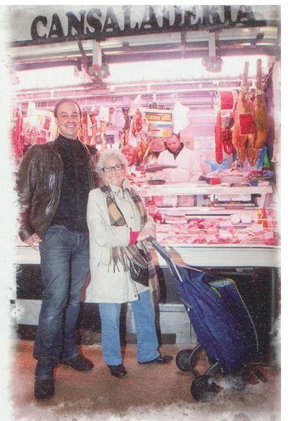
Nob s'inspire de certains lieux de Barcelone – comme c'est le cas avec cette boucherie – pour les décors de sa bande dessinée Mamette .