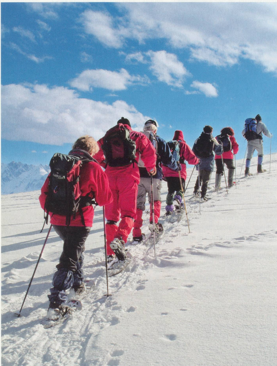
Cette discipline vous emmène dans des paysages grandioses sans avoir nécessité un apprentissage technique difficile. La raquette est en effet basée sur le mouvement naturel qu'est la marche.

En chaussant les raquettes, nos aînés nous prouvent qu'ils suivent les tendances. Certainement plus