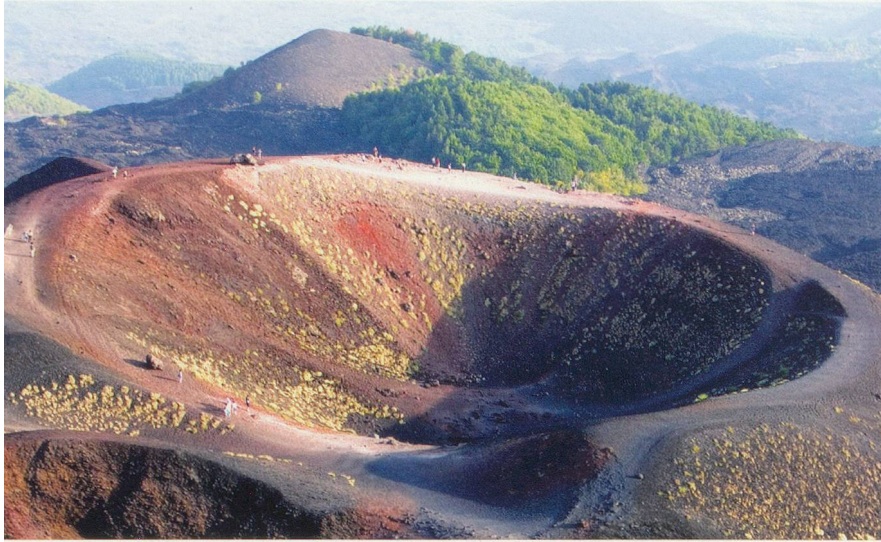
Culminant à 3300 mètres d'altitude, l'Etna est l'un des volcans les plus actifs au monde avec près de 100 éruptions au XX e siècle.