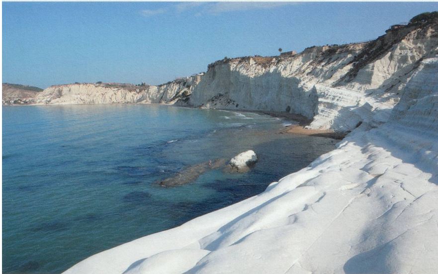
Scala dei Turchi, une plage éblouissante au propre comme au figuré avec son sable blanc.