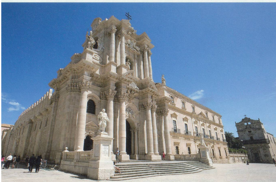
Construit au VI e av. J.-C., le temple dédié à Athena a été progressivement incorporé à la cathédrale de Syracuse dont il forme la nef et les bas-côtés.

plus belles plages de sable blanc de Sicile.