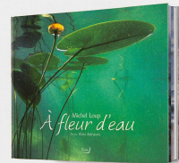
A fleur d'eau , Editions Titom, prix indicatif: 75 fr.