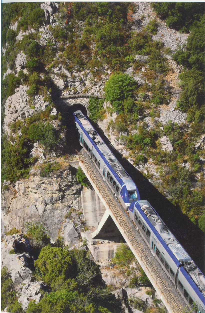
Sur la ligne du col de Tende, le «train des merveilles» emprunte des ouvrages spectaculaires qui raviront les passagers.