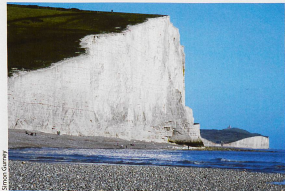
Les falaises de craie, près d'Eastbourne dans le sud de l'Angleterre, méritent le détour.