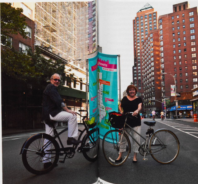
Faut-il s'en étonner? Cette nouvelle manière de découvrir une ville a été lancée à New York, en 1992 déjà. Et, depuis, la formule a fait des adeptes dans le monde entier.