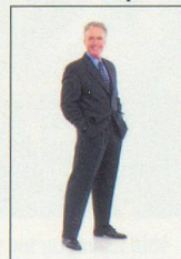
Photo en pied