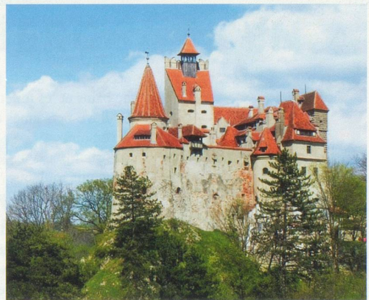
Même si aucun document historique ne l'atteste, le château de Bran est associé à Vlad Tepes et à Dracula, personnage qu'il a inspiré.

Vlad Tepes était connu pour faire subir le supplice du pal à ses ennemis, technique qu'il avait apprise en Turquie, où il avait été envoyé par son père en tant qu'otage entre 1442 et 1448! Cette période de captivité lui fera voir la vie (et la mort – la sienne interviendra en 1476 par décapitation) autrement. Il aurait ensuite tué des milliers de personnes par