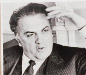
Le cinéaste italien Fellini consultait très souvent des médiums.