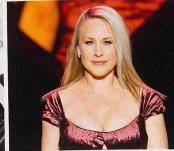
L'actrice Patricia Arquette interprète la plus célèbre des médiums à la TV.