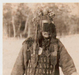
En Sibérie, le chaman échangeait avec l'au-delà lors de transes.

Ce n'était pas le but. Maintenant, c'est vrai que je ne suis pas une journaliste, je suis cinéaste. Et dans tous mes films, j'ai toujours travaillé par immersion. Et puis, je le reconnais: je suis persuadée qu'il y a des choses qui échappent à notre connaissance et à la science, l'hypothèse la plus vraisemblable est qu'il existe une vie après la mort. J.-M.R.