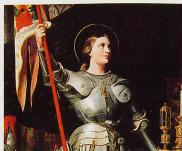
Jeanne d'Arc est classée par certains parmi les médiums clairvoyants.