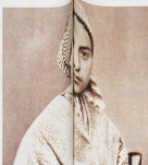
Bernadette Soubirou, elle vu la Vierge ou une autre?