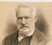
Victor Hugo dialoguait avec les morts grâce à une table tournante.