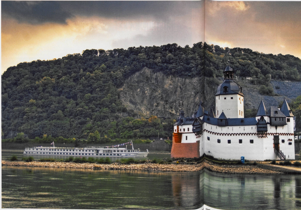
Le château de Pfalzgrafenstein a été érigé de 1326 à 1327 par le roi Louis IV de Bavière. Il avait initialement une fonction de station de péage. Une chaîne à travers le Rhin contraignait les navires à se présenter, et les commerçants récalcitrants

Des châteaux forts, des forteresses, des villages médiévaux... Entre Bingen et Coblenze, sur 65 kilomètres, les vestiges du passé mêlent histoire et légendes locales. Un décor propice aux chevauchées fantastiques et imaginaires.