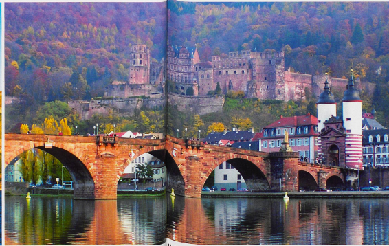
Impossible de ne pas la prendre en photo. La forteresse de Heidelberg (1398-1410) est devenue au fil des siècles une majestueuse demeure surplombant la rivière Neckar.

sons anciennes, ses deux églises gothiques, le château de Schönburg, parfaitement restauré après avoir été détruit par les Français – comme beaucoup de ses voisins – en 1689. Son impressionnante façade rougeâtre fait son effet.