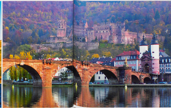
Impossible de ne pas la prendre en photo. La forteresse de Heidelberg (1398-1410) est devenue au fil des siècles une majestueuse demeure surplombant la rivière Neckar.

sons anciennes, ses deux églises gothiques, le château de Schönburg, parfaitement restauré après avoir été détruit par les Français – comme beaucoup de ses voisins – en 1689. Son impressionnante façade rougeâtre fait son effet.