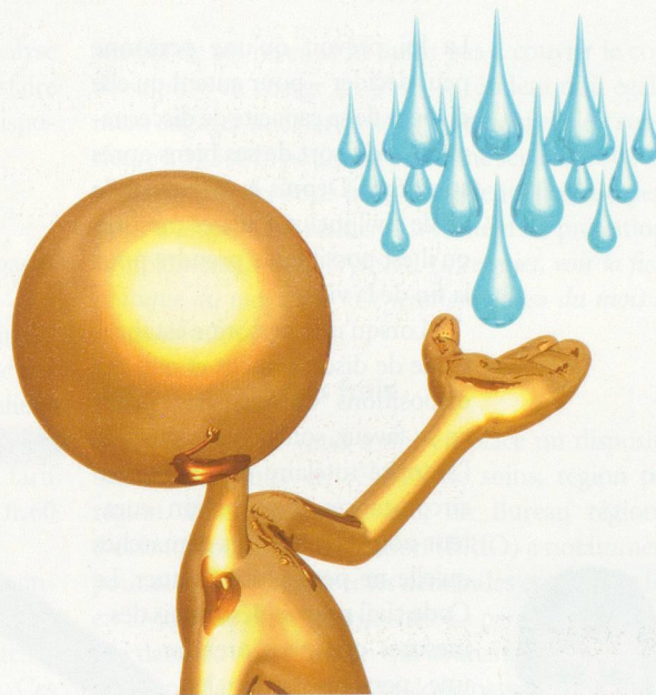
Scott Maxwell / LuMaxArt