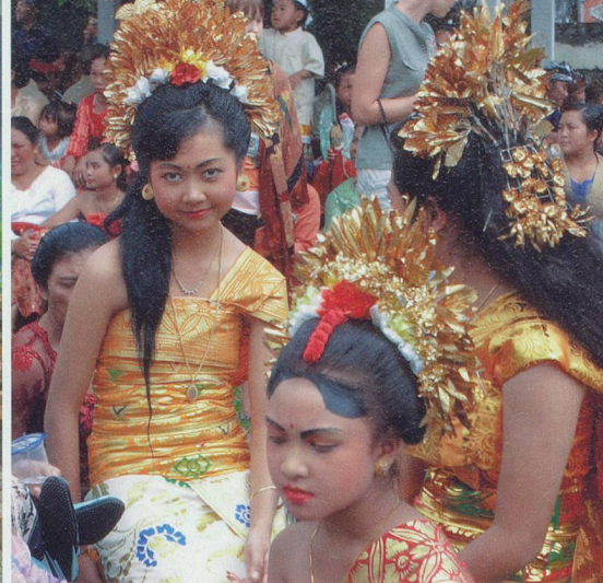
L'habit traditionnel balinais est d'un raffinement enchanteur.