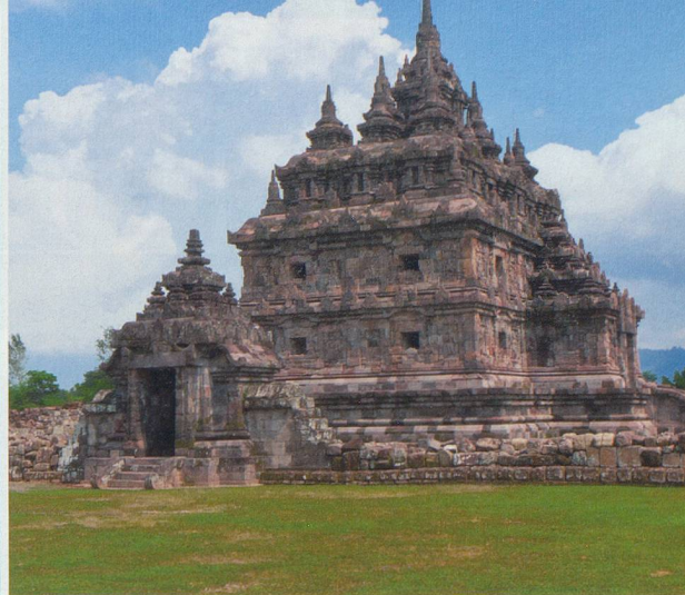
Avec près de 400 000 habitants, Yogyakarta est connue comme centre de l'art classique javanais et de la culture traditionnelle.