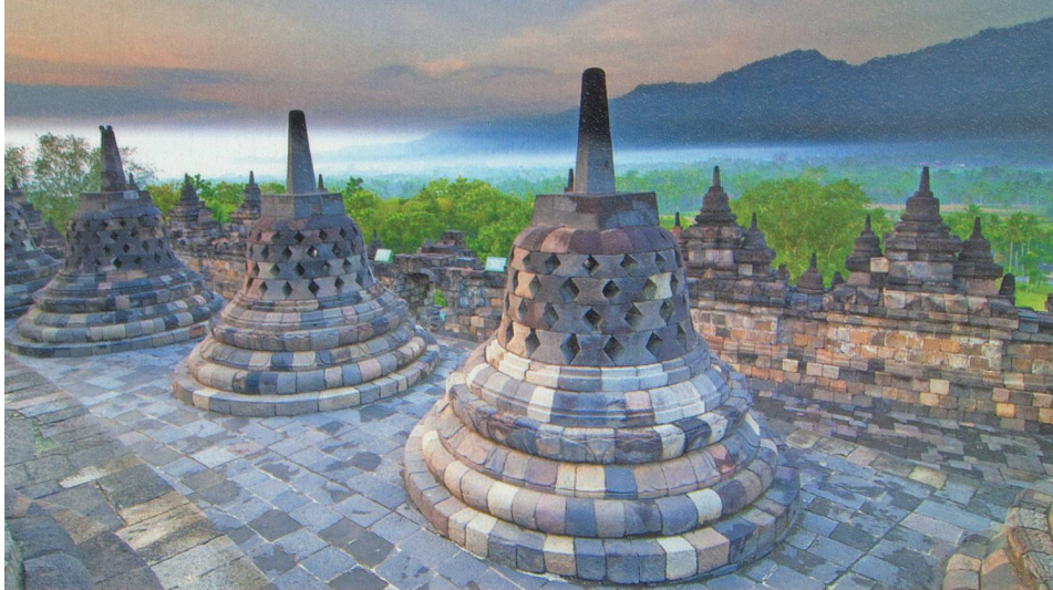
Borobudur, le plus grand monument bouddhiste au monde, et ses magnifiques stupas.