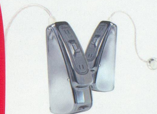
PHONAK AUDEO S SMART IX CERAMIC

LAUSANNE ECUBLENS GENÈVE NEUCHÂTEL MARTIGNY NYON