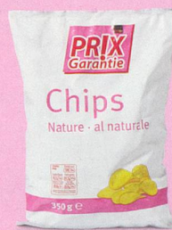
Chips nature Prix Garantie, 350 g (100 g = 1.05) 3.70