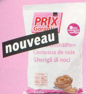
Cerneaux de noix Prix Garantie, 250 g (100 g = 1.68) 4.20