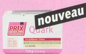
Préparation à base de séré fraise/pomme-banane/vanille Prix Garantie, 12 x 60 g (100 g = -.39) 2.75