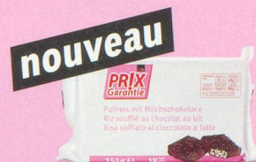
Galettes de riz enrobées de chocolat au lait Prix Garantie, 250 g (100 g = -.98) 1.95