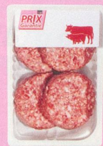
Galettes de viande hachée Prix Garantie, Suisse, en libre-service, 4 x 150 g (100 g = 1.37) 8.20