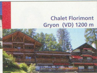
Chalet Florimont Gryon (VD) 1200 m