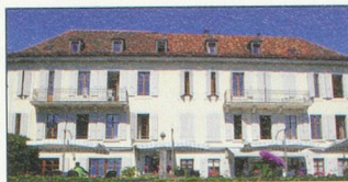
Nouvelle Roseraie St-Légier (VD) 480 m

Av. de la Gare 6 1003 LAUSANNE Tél.: +41 21 321 47 37