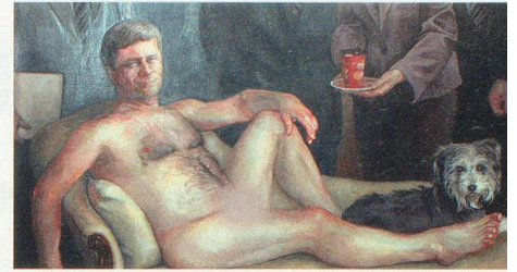
Ce nu du premier ministre canadien a fait scandale