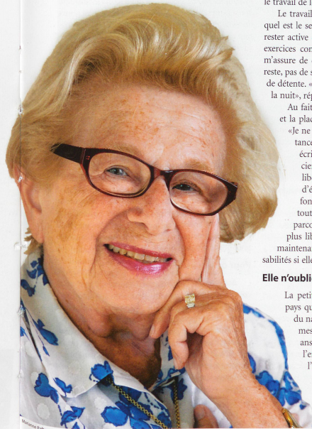
La sexologue américaine en est certaine: «Les gens doivent rester sexuellement actifs, même après 50 ans.» Pour sa part, elle travaille toujours autant aujourd'hui.