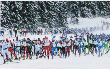
Le départ est toujours impressionnant, aussi bien pour les spectateurs que pour les participants.

glisse avec sa femme et ses quatre enfants, alors que Gilbert Capt y a initié ses deux enfants et ses deux