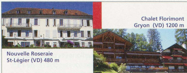
Chalet Florimont Gryon (VD) 1200 m