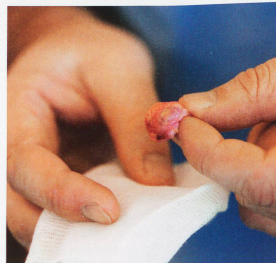
L'ovaire, dont l'extraction est l'aspect le plus délicat de l'opération, mesure un centimètre, pas davantage! «La stérilisation précoce, en particulier des bouledogues, réduit les risques de cancer des mamelles», précise le vétérinaire.