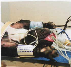
Endormie et sous le contrôle d'un monitoring, la chienne est attachée sur la table d'opération, la langue maintenue à l'extérieur. «Il s'agit d'éviter que Zylva ne tombe, commente le vétérinaire, car cette table est basculante.»