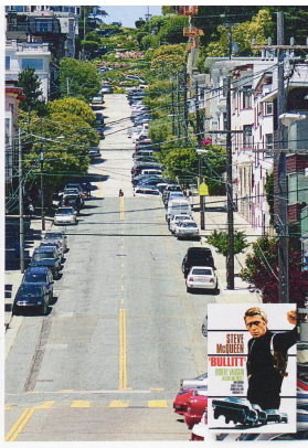
📍 SAN FRANCISCO Sur les traces de Steve McQueen dans Bullitt .