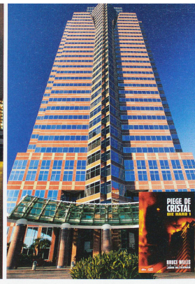
📍 LOS ANGELES Coup dur pour Bruce Willis dans Piège de cristal où la tour est prise d'assaut.