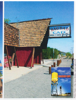
📍 ROUTE 66 Souvenez-vous de la voix envoûtante de Jevetta Steele dans Bagdad Café .