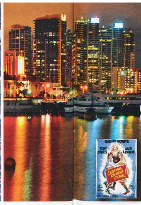
📍 SAN DIEGO La magnifique Marilyn Monroe y tourne pour Certains l'aiment chaud !