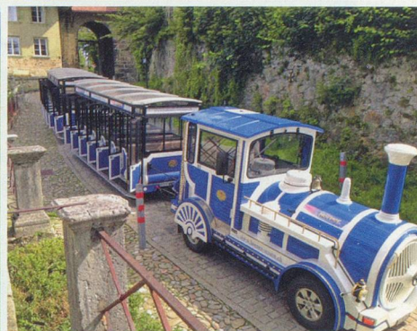
Vélo, marche ou visites, un joli panel d'activités pour ce mois de mai.