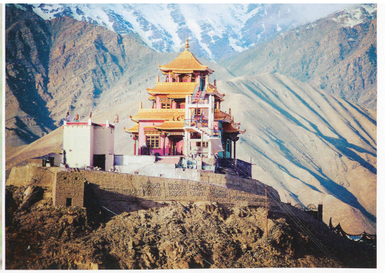
A l'ombre du Manaslu, le huitième plus haut sommet du monde (8163 m.), les touristes croiseront aussi bien des Népalais que des temples au cours de leurs randonnées pédestres.