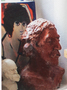
«Ma première sculpture, c'est celle-ci. C'est le visage de mon premier amour. Je l'ai réalisée en 1947.»