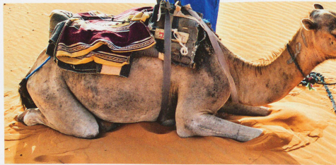
L. P. / G. P.

En suivant l'écran de verdure dessiné par le Drâa, qui ressemble presque à un mirage dans cet environnement aride,