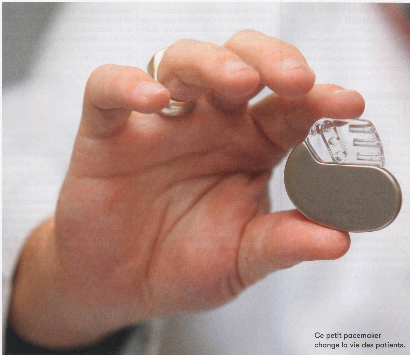
Ce petit pacemaker change la vie des patients.