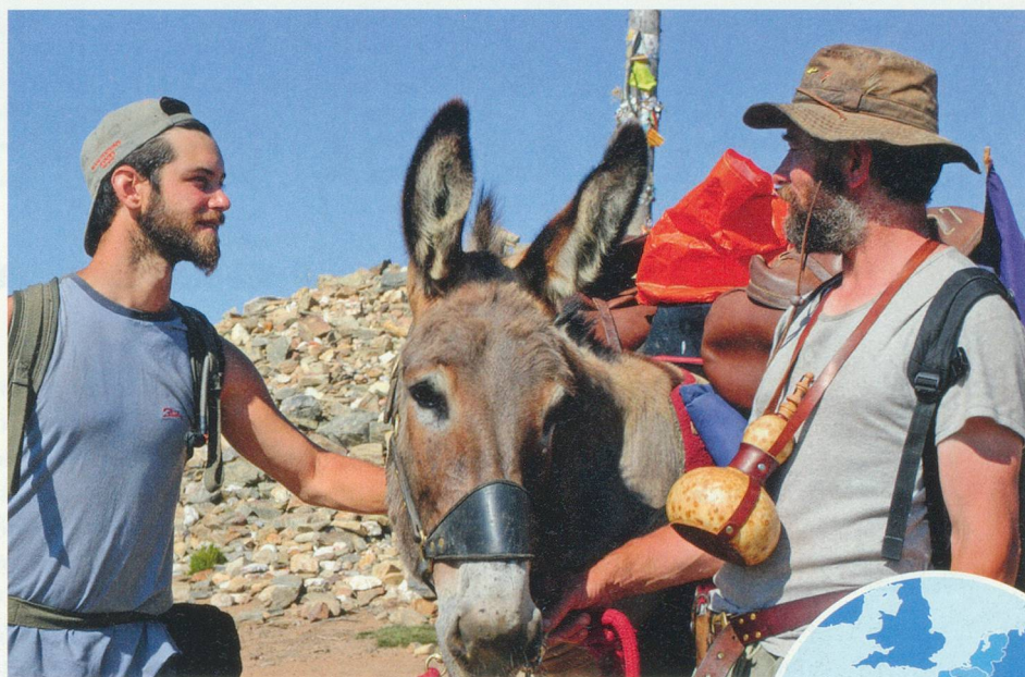
Tout au long de la route, les pèlerins font connaissance, partagent leurs expériences. Des moments forts...

Une fois les muscles chauffés et les douleurs de la veille oubliées, c'est la beauté des paysages traversés qui emplit l'âme des voyageurs. Ou alors le souvenir des siècles passés, de l'époque où les croyants devaient se battre aussi contre les loups et les brigands