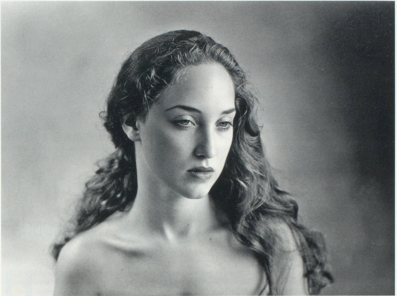
Atelier, Lutry, 1996.