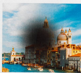
Début de DMLA