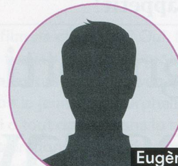
Eugène Pichon (Date inconnue)