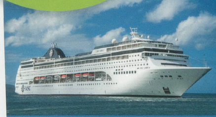
Votre bateau: MSC Lirica ****

Tous les jours non mentionnés sont des journées en mer.