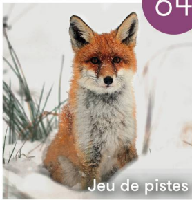
Jeu de pistes