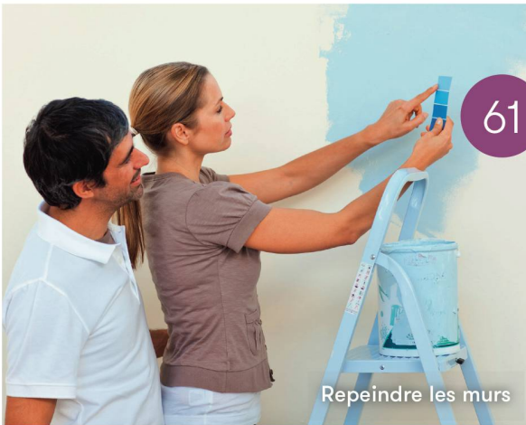
Repeindre les murs