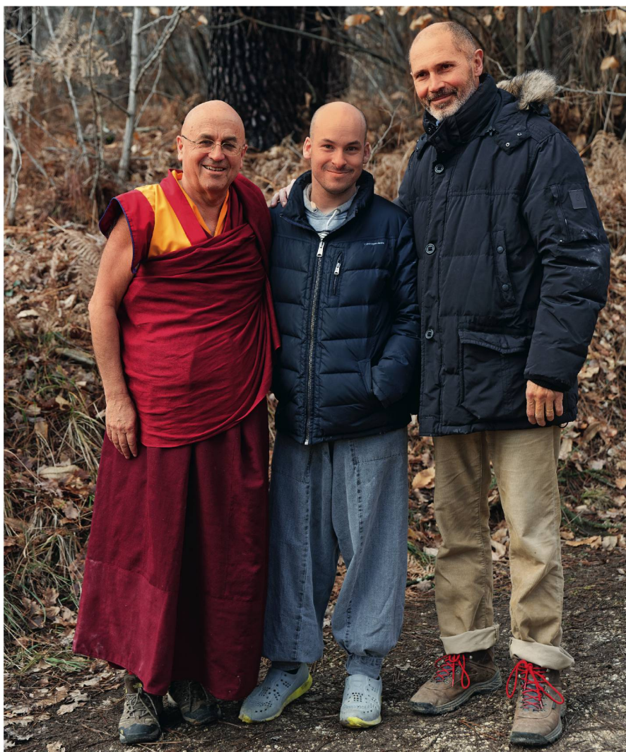
Alexandre Jollien vient de sortir un livre d'entretiens avec ses collègues Trois amis en quête de sagesse ; Matthieu Ricard, Alexandre Jollien et Christophe André, le moine, le philosophe et le psychiatre.

Pas facile, dans ces conditions, de profiter de la paix et du repos sans imaginer qu'une nouvelle tuile va s'abattre sur notre vie.